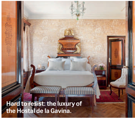
Hard to resist: the luxury of the Hostal de la Gavina.