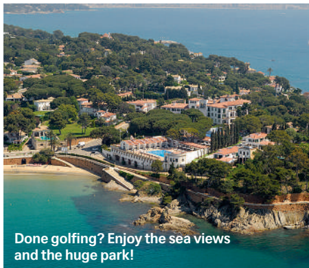
Done golfing? Enjoy the sea views and the huge park!

“Hostal” is an understatement: The days when La Gavina was a simple guest house are long gone. It's now an elegant hotel village with 74 rooms plus a gourmet restaurant, located in the bay of Sant Pol. The local Taverna del Mar fish restaurant, which is owned by the hotel, is warmly recommended, too. And there are five 18-hole golf courses in the local area. lagavina.com