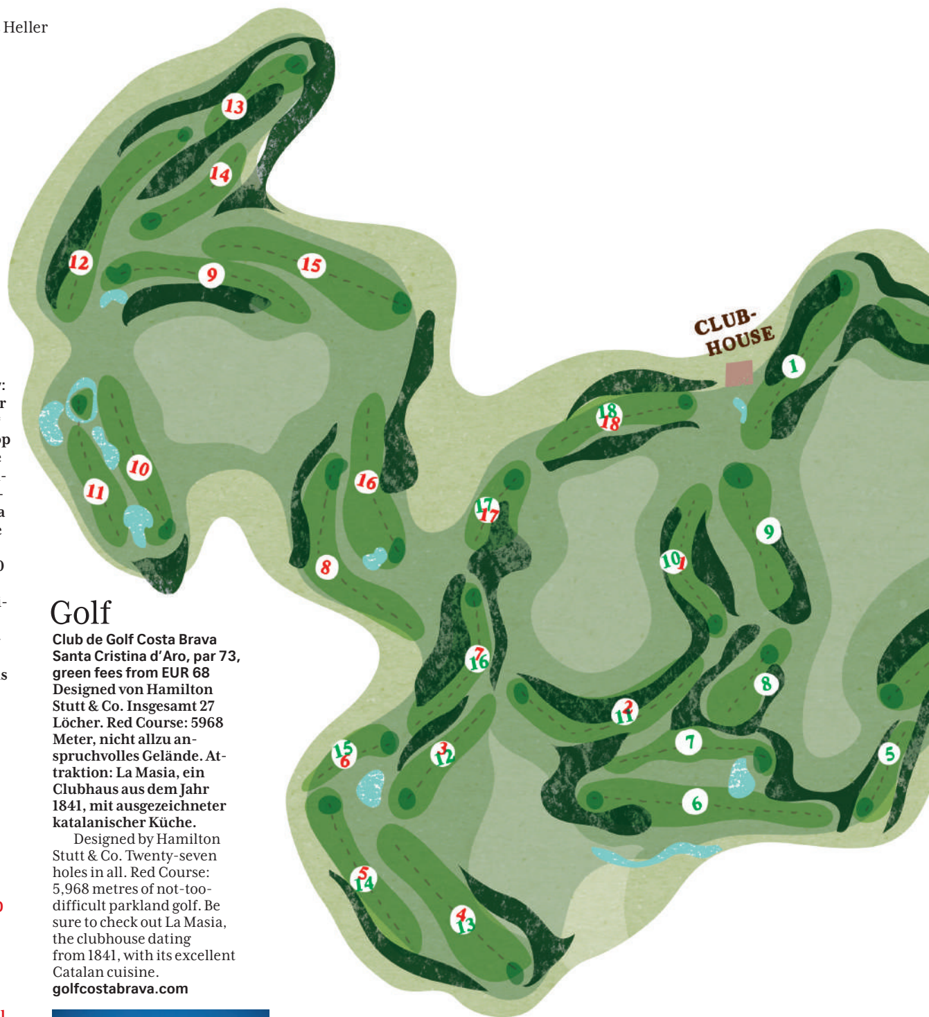
Illustration: Maya Wäber