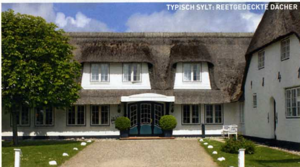
TYPISCH SYLT: REETGEDECKTE DÄCHER

und Bungalows, internationaler Gourmetküche und einem Spa by Elemis. NICHT VERSÄUMEN Eine Umrundung des steil ins Meer abfallenden Bergs Athos auf der hoteleigenen Motorjacht. Oder zwei Nächte im 90 Autominuten entfernten Thessaloniki – im zweiten Standbein der Familie, dem „Excelsior“, einem feinen Stadthotel in einem neoklassizistischen Gebäude von 1924 mit 23 Zimmern und elf Suiten. DZ ab 145 Euro, Info: eaglespalace.gr