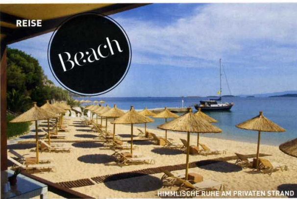
HIMMLISCHE RUHE AM PRIVATEN STRAND