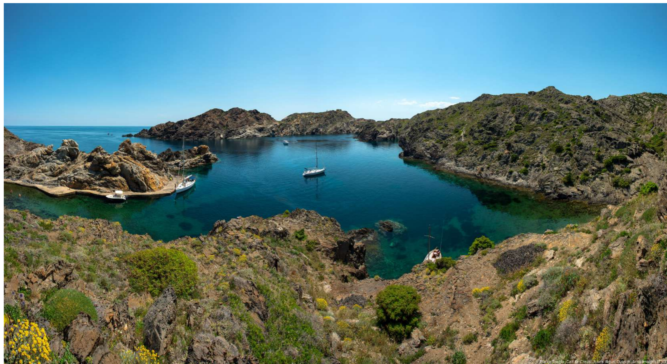
COSTA BRAVA (Bild - Cap de Creus, Patronat de turisme)